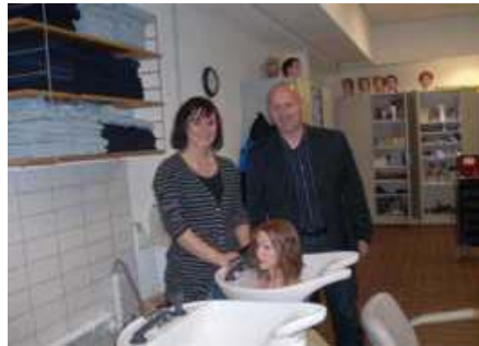
HW K Wiesbaden

→ Viele Berufsbildungsstätten sind in den Startlöchern