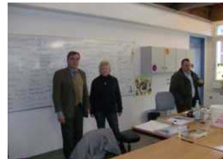
HW K Reutlingen